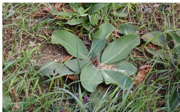
Obr. 4. Přízemní listy limonky Gmelinovy ( Limonium gmelinii) jsou sečí vegetace středního dělicího pásu dotčeny jen málo; dálnice D2 u Rakvic (37,0–36,5 km), 12. 9. 2015.

Fig. 3. Limonium gmelinii in the central reservation of the D2 motorway near Rakvice (37.0–36.5 km), 20 September 2015.