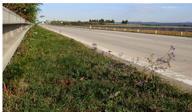
Obr. 3. Limonka Gmelinova ( Limonium gmelinii) ve středním dělicím pásu na dálnici D2 u Rakvic (37,0–36,5 km), 20. 9. 2015.

Vegetace středního dělicího pásu se nejméně jednou ročně seče, avšak v různých letech může být počet sečí i jejich ter-