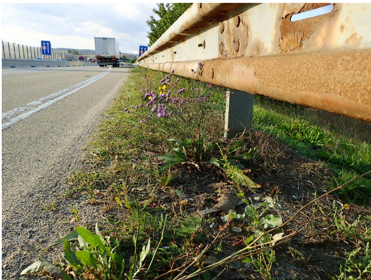
Obr. 2. Limonka Gmelinova ( Limonium gmelinii) na krajnici dálnice D1 u Ostrovačic (178,5–178,0 km), 29. 9. 2015.