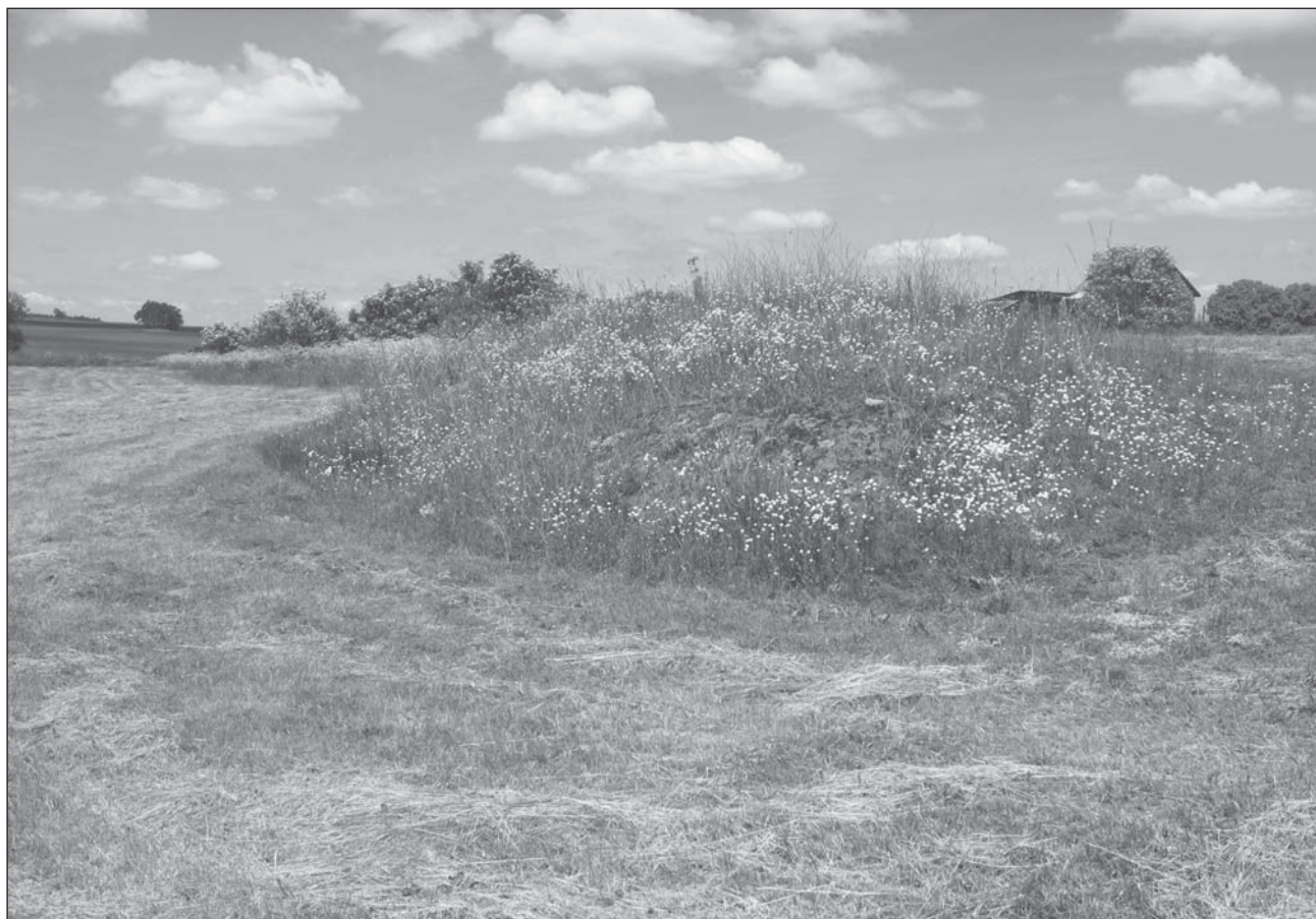
Obr. 2. Fotografie ostrůvku s vegetací acidofilního úzkolistého trávníku u Valdíkova, klasifikovaného do asociace Jasiono montanae-Festucetum ovinae (lokality fytoecologického snímku č. 32, fotografováno 19. června 2005).

Fig. 2. Photo of a small patch of acidophilous grassland near Valdíkov, classified into the association Jasiono montanae-Festucetum ovinae (locality of relevé No. 32, photographed on June 19 2005).