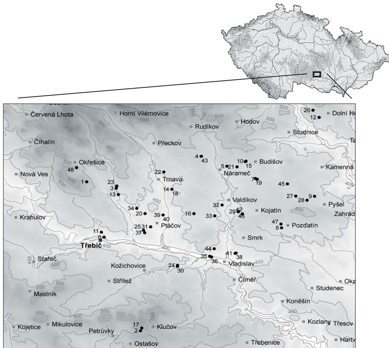
Obr. 1. Mapa studované oblasti s vyznačenými lokalitami fytoocenologických snímků. Fig. 1. Map of studied area with positions of the phytosociological relevés.

kotliny (Jevišovická pahorkatina) a Bítešské vrchoviny (Křižanovská vrchovina) (Demek 1980). Osou území protéká řeka Jihlava s výrazným neckovitým údolím s plochou a širokou nivou a místy prudkými až skalnatými údolními svahy; údolí s prudkými svahy vytvářejí i některé menší přítoky. Po geologické stránce (Kalášek 1980) je území poměrně homogenní, leží v oblasti tzv. třebíčského plutonu, tvořeného především žulosyenity – hlubinnými vyvřelinami středně zrnité struktury, kterým přítomnost tmavého biotitu a amfibolu a světlých živců, křemene a plagioklasu dodává charakteristické černobílé zbarvení (jak je patrné na typických tmavých venkovských stodolách, které byly v minulosti z tohoto materiálu na Třebíčsku stavěny). Celé území je rozrušeno několika geologickými zlomy, z nich nejvýraznější je zlom východo-západního směru, který kopíruje údolí řeky Jihlavy východně od Třebíče. Klima oblasti je mírně teplé, severozápadním směrem jí