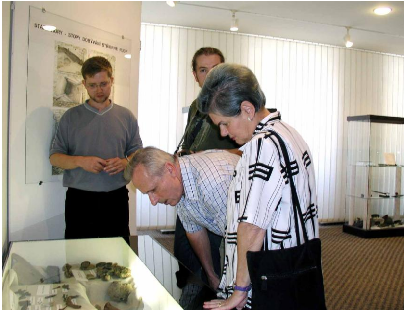
Výstava Hornictví na Vysočině z pohledu archeologie – září 2004