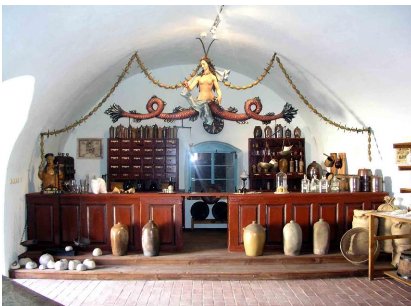
Nově instalovaný „Kupecký krám“ v přízemních prostorách rekonstruovaného hradního objektu v Polné – červen 2004

Budování expozic a výstav podpořilo materiálně i finančně významnou měrou město Polná.